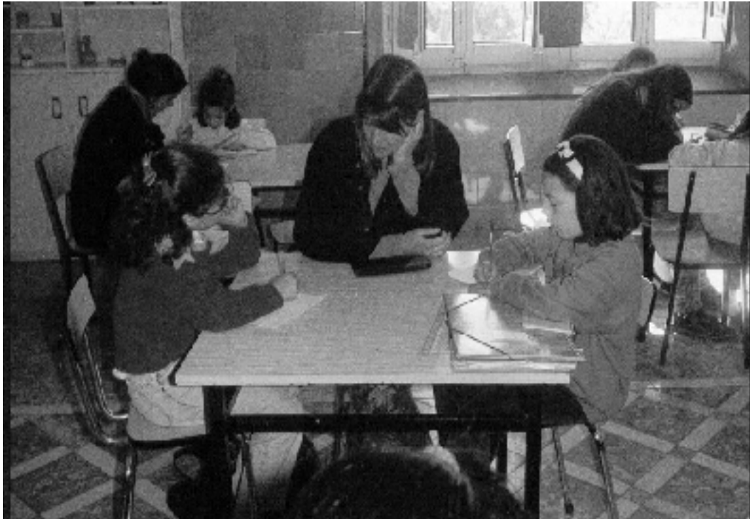
JOVINS Refuerzo Escolar