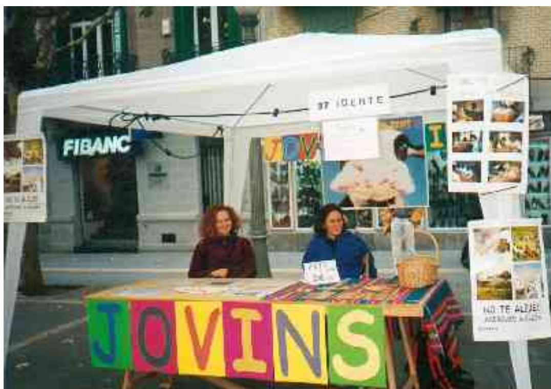
Proyecto de educación para la prevención e integración social de la infancia y juventud del siglo XXI