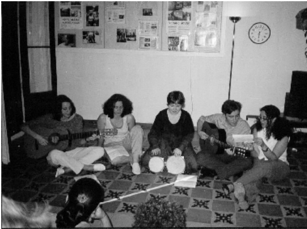
JOVINS Humanístico/Artístico .