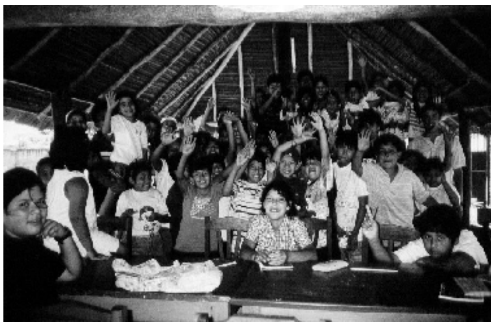
Campamento de Navidades

Centro de Acogida / Escuela pública de Formación Profesional San Miguelito