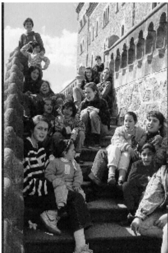
JOVINS Aire libre