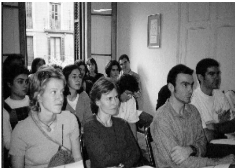
ESCUELA DE PROFESORES en Barcelona

- ESCUELA DE PROFESORES . Es la escuela de formación de Juventud Idente, la cual ofrece programas de formación de ámbito nacional y local.